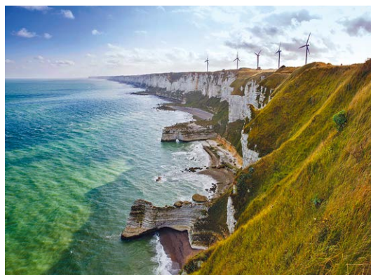
アラバスター海岸