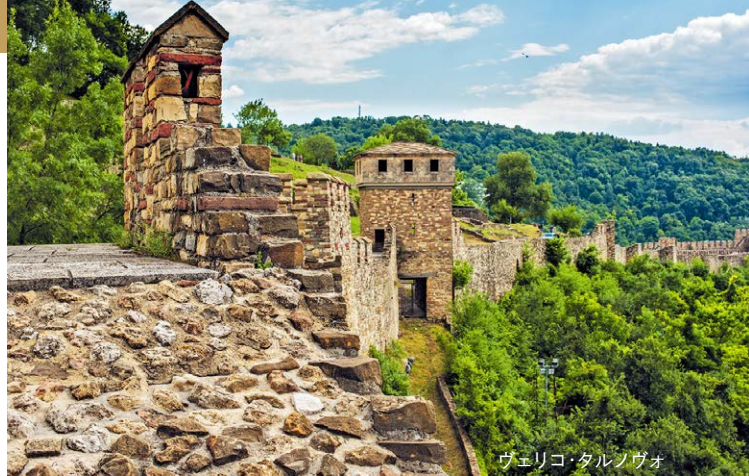
ヴェリコ・タルノヴォ

※上記ハイライトの内容は変更になる場合がございます。 ● フリーチョイス ● シーニック・エンリッチ S シーニック・サンダウナー