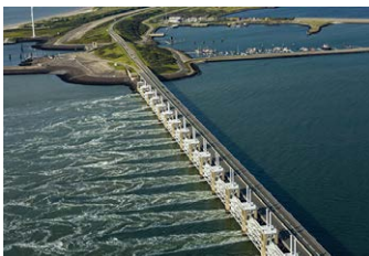
フェーレ (オランダ)

ゼーランド州のフェールセ湖に面している町。ライン川河口のデルタを高潮から守る水門があります。