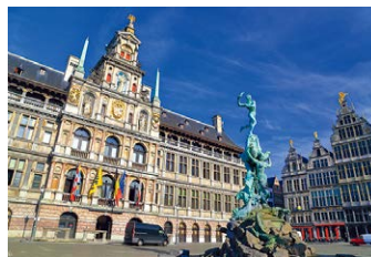
アントワープ (ベルギー)

ゼーランド州のフェールセ湖に面している町。ライン川河口のデルタを高潮から守る水門があります。