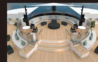
オブザベーションテラス

船内には「アクティブな時間」と「ゆったりとした時間」を楽しめる洗練された空間が広がります。海に直接アクセスできるマリナプラットフォームや、海と一体感を感じられるインフィニティプール。そして世界的に有名な「ザ・リッツカールトン・スパ」など、多彩なスペースをお楽しみください。