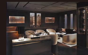
ヒューミッドル(シガールーム)

Travel Agent is not affiliated with The Ritz-Carlton Hotel Company or its affiliates. Cruises are provided by Cruise Yacht OpCo, Ltd dba. The Ritz-Carlton Yacht Collection, which operates under a license agreement from The Ritz-Carlton Hotel Company, L.L.C.