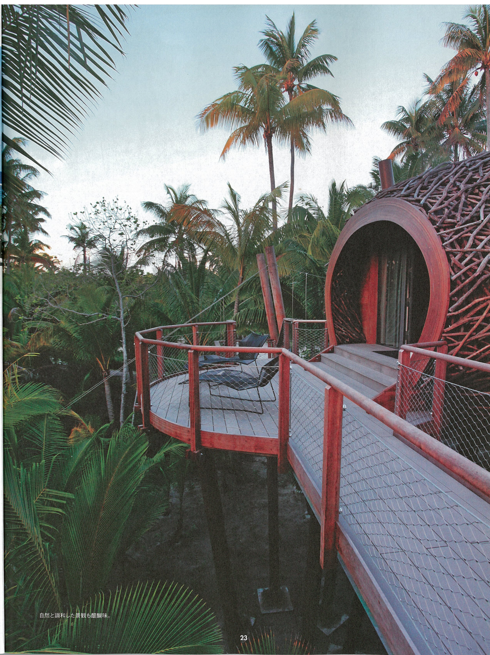
自然と調和した景観も醍醐味。