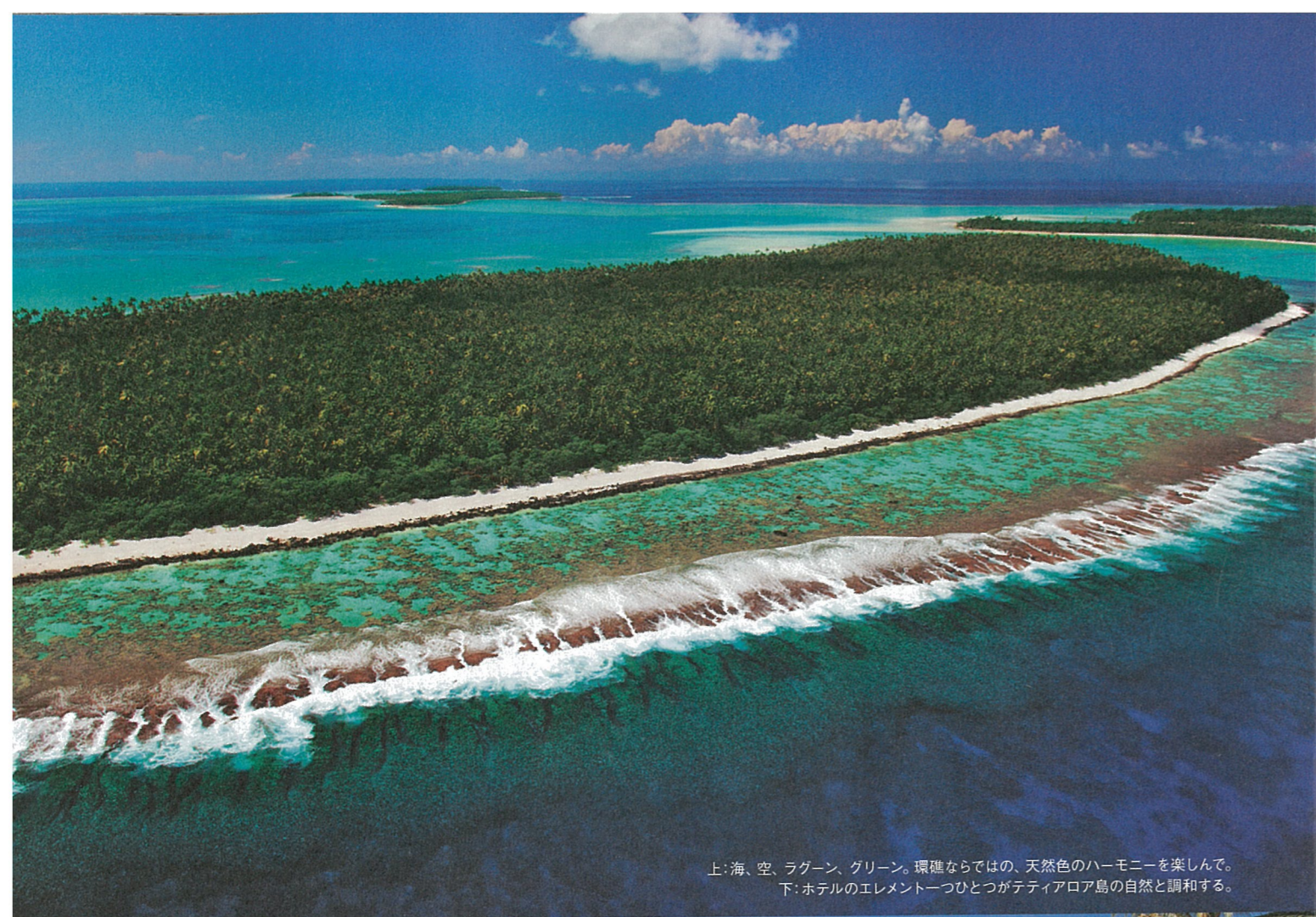
上: 海、空、ラグーン、グリーン。環境ならではの、天然色のハーモニーを楽しんで。 下: ホテルのエレメント一つひとつがティアロア島の自然と調和する。