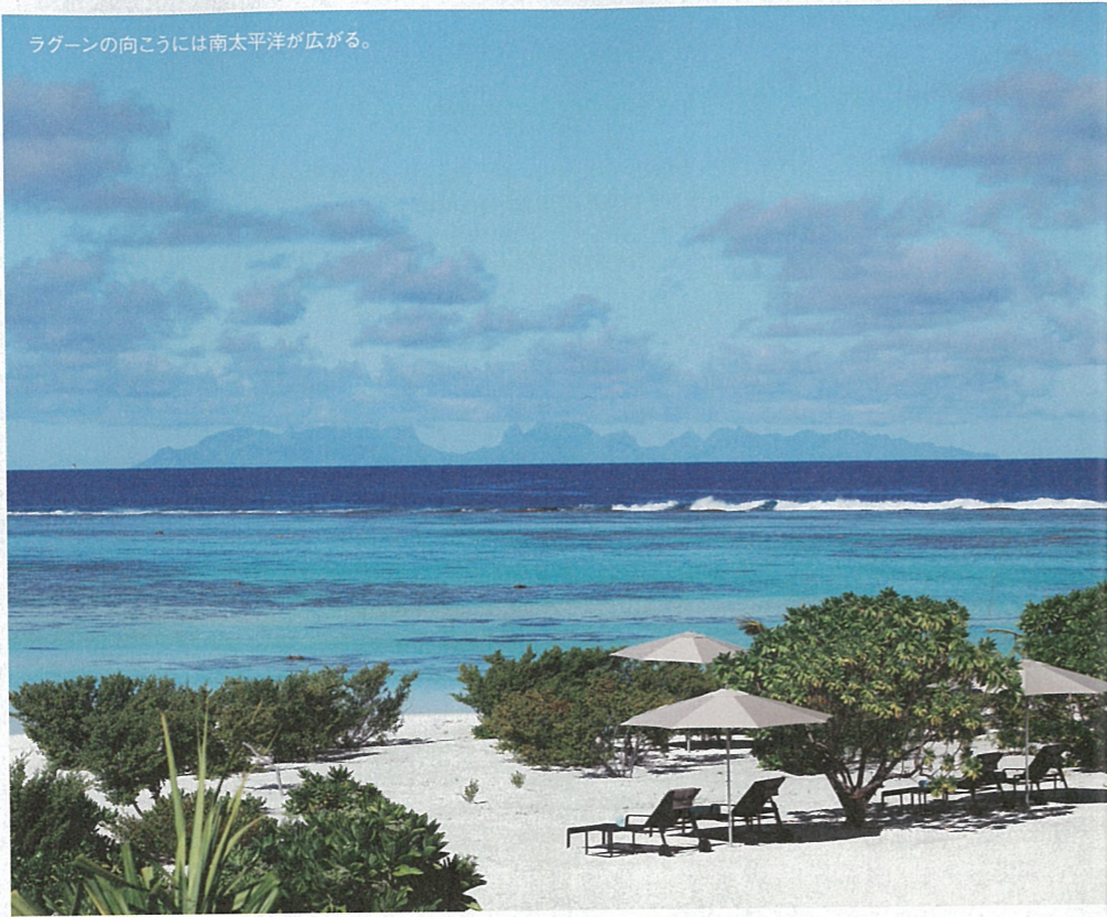
ラグーンの向こうには南太平洋が広がる。

ホテル、ザ・ブランドのあるテティアロア島へと小型機が近づくにつれ、島の様子が少しずつ見えてくる。まるで、宝物のヴェールがゆっくりとはずされていくように。繊細なグリーンの水平線が、紺碧の太平洋と淡青色のポリネシアの空との間に、境界線を引く。島には12のモツ（タヒチ語で小島の意）があり、どれもココヤシの木に覆われ、古い噴火口を丸く取り囲んでいる。総面積は6kmとかなり小さい。内側には世界有数の美しいラグーンがあり、えもいわれぬターコイズブルーに輝く。太陽の光が当たると輝きを増し、乳白がかった独特の色へと変化する。オリジナルカクテル“テティアロア・ウォーター”はこの色にインスパイアされて誕生したという。創案者はザ・ブランドのチーフバーテンダー、オーレリアン。まずウォッカにティアレフラーワーを絞る。そこにグレープフルーツジュースと凍らせたココナッツウォーターを混ぜたら、最後にキュラソーを一滴。これで出来上がりだ。かのレオナルド・ディカプリオも、友人とともに滞在した際にこのカクテルを味わい、気に入っていたという。オーレリアンがさまざまなドリンクをサーブする円形のカウンターは、砂浜に直に作られ、ビーチから奥まった場所にある。