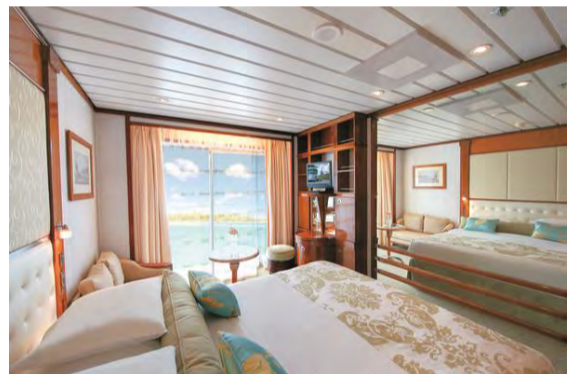
～客室一例～ C/D バルコニー・ステートルーム 22.2 m 2 (プライベートバルコニー付)