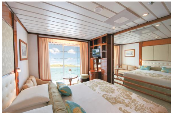
～客室一例～ C/D バルコニー・ステートルーム 22.2㎡(プライベートバルコニー付)